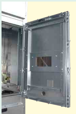
2 Vielfach-Verrastung der Türen sorgt für hohe Druckfestigkeit im Störlightbogenfall