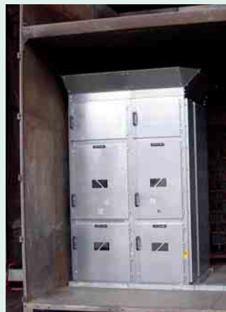
3 Prüfaufbau der Schaltfelder mit schrägen Ableitblechen oben