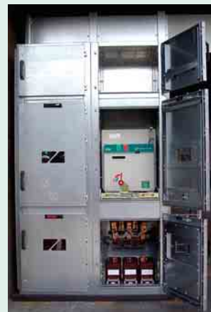
4 Prüfaufbau der Schaltfelder mit einem Druckentlastungskanal oben Offene Türen zeigen Innenausbau