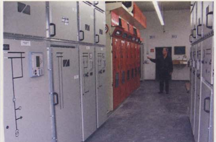
Bild 8: Beispiel einer schrittweisen Umrüstung der MS-Schaltfelder (Umspannwerk 2 der SW Waiblingen). Im Hintergrund (rot) noch ein Anlagenstück des Baujahres 1975

integrieren (Bilder 5 und 7), die auch störlichtbogengeprüft sind. Ein Musterbeispiel der Umrüstung einer älteren Mittelspannungs-Doppelschienen-Schaltanlage – wie am Beispiel der Stadtwerke Waiblingen gezeigt [7] – rechnet sich und bringt für den Betrieb beachtliche Vorteile. Wichtig ist in jedem Fall eine gute Koordination der Arbeiten, und dass die neuen Schaltfelder nach dem neuesten Stand des Personen- und Anlagenschutzes auch störlichtbogengeprüft sind (Bild 8). Für die Stadtwerke Waiblingen ist u. a. wichtig, dass der Anlagenbetrieb auch während der Umrüstung und Modernisierung jederzeit gewährleistet, dass die Kunden von der Maßnahme unbehelligt bleiben. Es ist eine Frage der Zeit, wann ältere Schaltanlagen gegen neue technische Ausführungen ausgetauscht werden müssen. Es steht aber außer Frage, dass dann die Ersatzanlagen an den neuesten technischen Bedingungen und Bestimmungen gemessen werden. Dies ist besonders wichtig bei einem Unfall, denn der Anlagenbetreiber ist für den ordnungsgemäßen Zustand der Anlage verantwortlich.