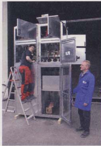
Bild 3: Errichtung der zu prüfenden Schaltfelder bei der FGH im Beisein des Kunden, SW Waiblingen