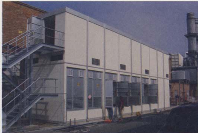
Bild 7: Anlagengebäude aus Betonfertigteilen für sieben Transformatoren im unteren Teil und sechs NS-Schaltanlagen im oberen Teil