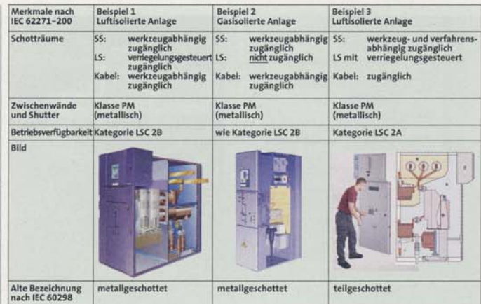
Bild 1: Beispiele für die neue Klassifizierung nach VDE 0671 Teil 200 und die alten Bezeichnungen

Geschäftsführer der IGV Elektrotechnik, Ladenburg