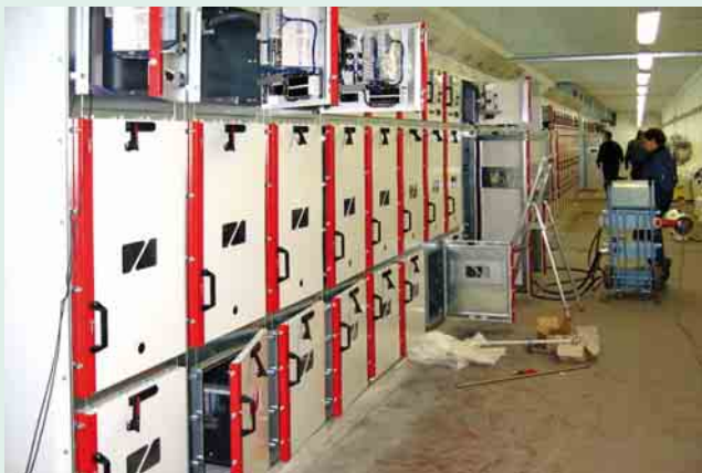
3 Montage der Schaltfelder