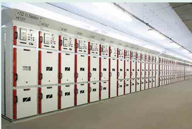
2 84 Mittelspannungs-Schaltfelder im Schaltanlagenraum