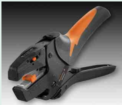
➊ Mit neuen Funktionen ausgestattet: Das Abisolierwerkzeug Stripax