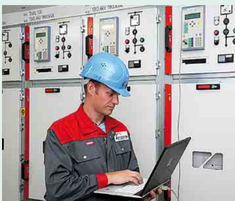
4 Leittechnik in den Schaltfeldern